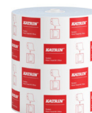
460263 Katrin Dispenser Paper Towel Roll System Medium 2-Ply, Blue