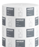
82537 Katrin Plus Dispenser Paper Towel Roll System