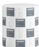
82537 Katrin Plus System Handtuchrolle