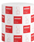
460201 Katrin Dispenser Paper Towel Roll System Medium 1-Ply