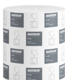
38015 Katrin Plus Dispenser Paper Towel Roll System M 3-Ply