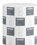
57795 Katrin Plus Dispenser Paper Towel Roll System Medium 2-Ply