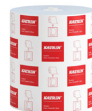
460263 Katrin System Handtuchrolle M 2-lagig, Blau