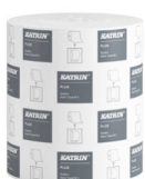
38015 Katrin Plus System Handtuchrolle M 3-lagig