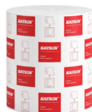
460102 Katrin System Handtuchrolle M 2-lagig