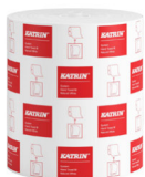
460201 Katrin System Handtuchrolle M 1-lagig