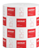
460102 Katrin Dispenser Paper Towel Roll System Medium 2-Ply