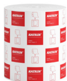
460232 Katrin System Handtuchrolle L 2-lagig

Beispielhafte Auswahl aus allen Ländern. Die Verfügbarkeit für einzelne Regionen finden Sie auf der Webseite.