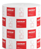
460232 Katrin Dispenser Paper Towel Roll System Large 2-Ply

Selection from all countries. Please refer to web page for market-specific availability.