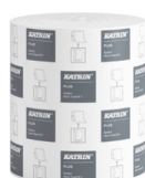
57795 Katrin Plus System Handtuchrolle M 2-lagig