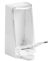
0.7 l Spender (weiss)